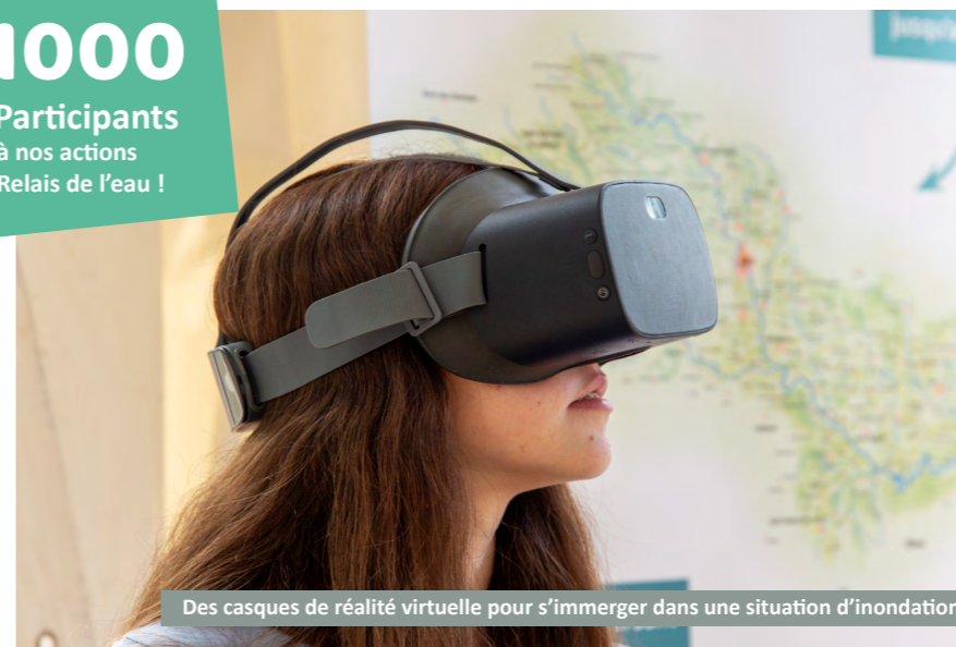
Des casques de réalité virtuelle pour s'immerger dans une situation d'inondation