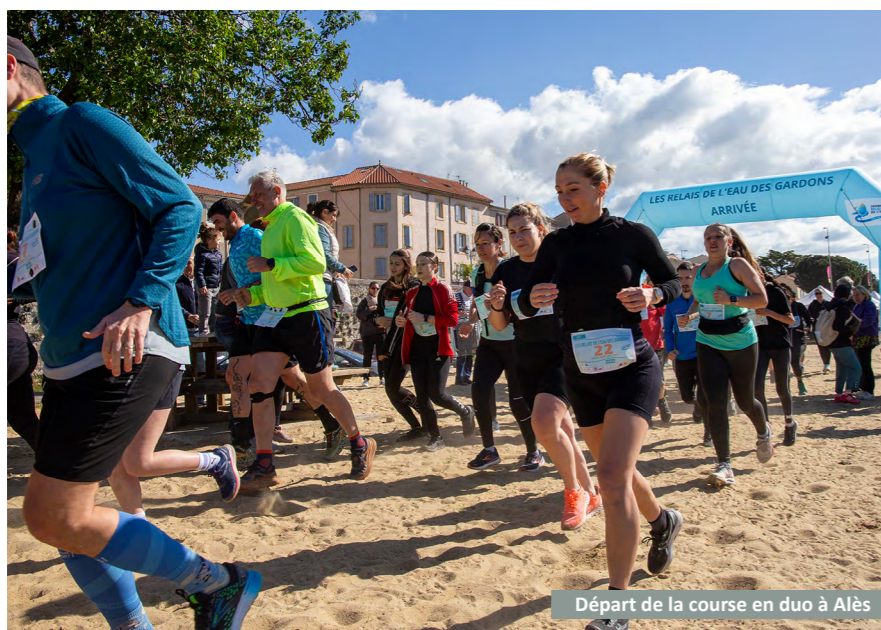
Départ de la course en duo à Alès

Solidarité et esprit d'équipe : voilà 2 valeurs communes entre le sport et la gestion de l'eau par bassin versant que nous avons souhaité mettre en avant lors des Relais de l'eau des Gardons ! Avec notre prestataire sportif, Nutri-Sport Coaching by Maé , nous vous avons proposé de participer à deux courses à pied (à Alès et au Pont du Gard) et à deux randonnées (à St-Privat-de-Vallongue et à St-Chaptes), où la part belle a été donnée à l'entraide plutôt qu'à la compétition. Grand merci au Parc national des Cévennes , à l' Office Français de la Biodiversité et à l'association Gard Nature , qui se sont joints à nous pour agrémenter les randonnées de points d'arrêts pédagogiques où ont été discutés les différents grands enjeux liés à l'eau !