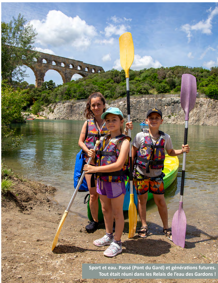
Sport et eau. Passé (Pont du Gard) et générations futures. Tout était réuni dans les Relais de l'eau des Gardons !

Les élus de notre établissement public, et toute notre équipe, ont eu le plaisir de vous offrir des défis sportifs (course à pied, randonnée, canoé), des animations pédagogiques et ludiques proposées avec nos nombreux partenaires, ainsi que des événements artistiques variés pour vous détendre et vous informer autrement (expositions de photos et de dessins, concerts, pièce de théâtre, cinéma-débat) !