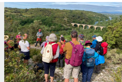
Randonnée le 04/05 à Russan avec la Fédération de Randonnée du Gard (FFRandonnée Gard)